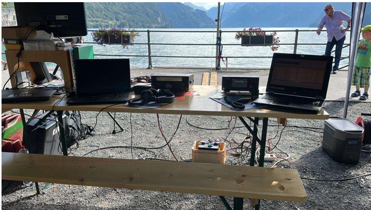
Der Ausblick vom «Shack» war grandios.